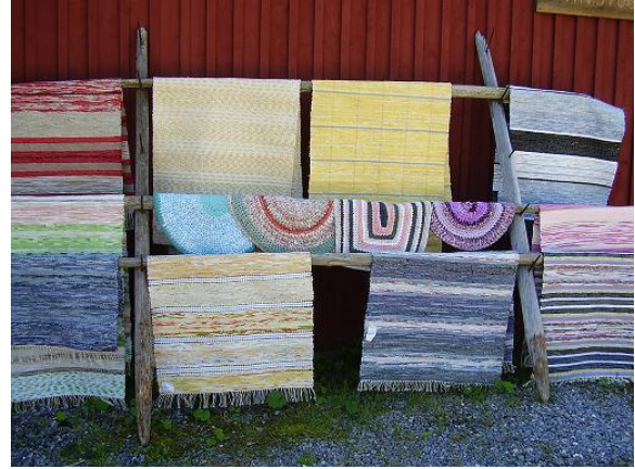
Hemgjorda trasmattor till salu