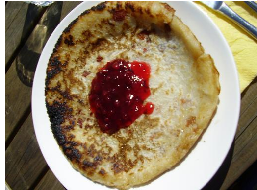
Lewi steker kolbullar, en omtyckt maträtt från skogshuggartiden.