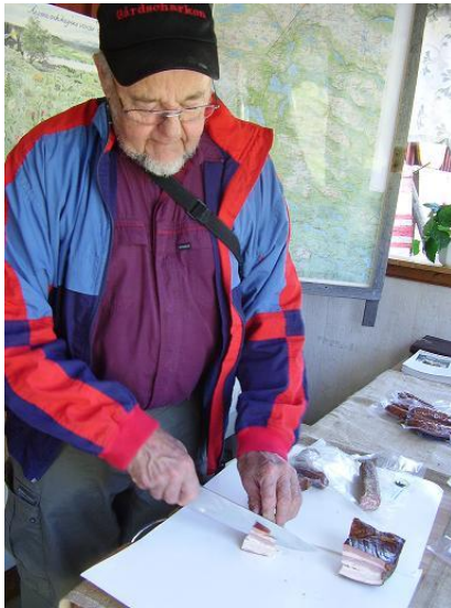
Sören från Fågelberget säljer goda korvar, rökt älgkött och rökt fläsk