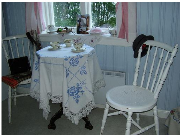
Varje år anordnas en liten temautställning.