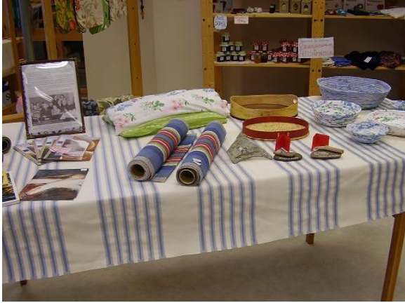
Försäljning av olika hantverk