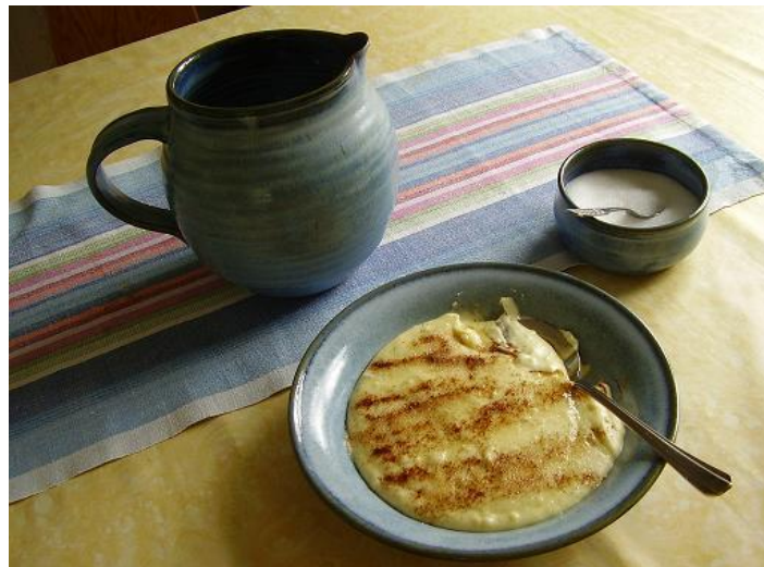
På söndagar serveras römgröt, festmat från gamla tider.